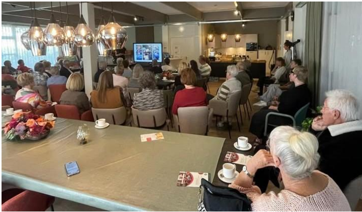
Themabijeenkomst Gynaecologische kanker (25 september)