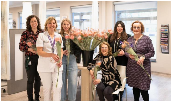
Wereldkankerdag (4 februari)