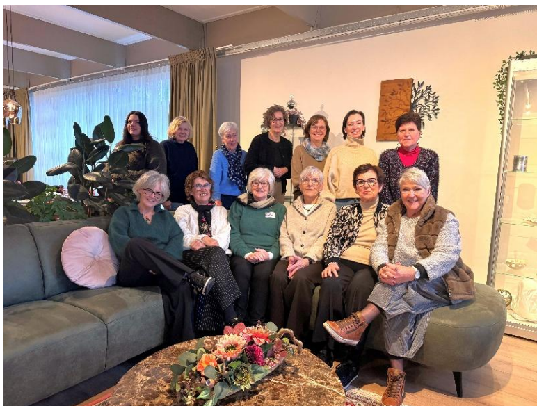
Een aantal van onze vrijwilligers op de foto op onze locatie in Roosendaal!

Onze vrijwilligers vormen het hart van de organisatie. Dankzij hun betrokkenheid, professionaliteit en bereidheid om zich te blijven ontwikkelen, kunnen wij onze kwetsbare doelgroep ondersteunen met een zorgvuldige balans tussen nabijheid en professionele afstand.